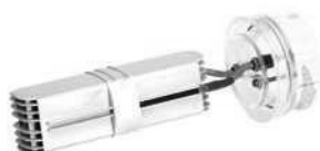
ORIGINAL ANTES DE 2010