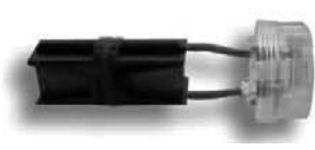
ORIGINAL DESDE 2010