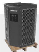
Se entrega en paleta de madera