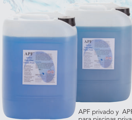
APF privado y APF público: para piscinas privadas y públicas