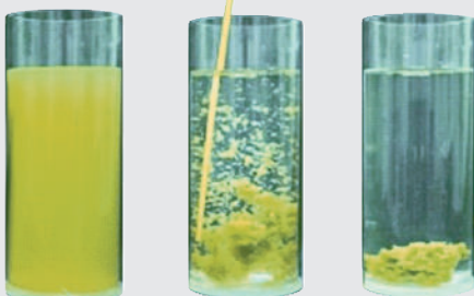
Ejemplo de un proceso de floculación

Ningún floculante o coagulante sencillo es capaz de eliminar todas las partículas del agua. El APF es una combinación precisa de 10 diferentes electrolitos y polielectrolitos capaces de cubrir el rango más amplio posible. Los contaminantes disueltos en el agua suponen un 80% de la demanda de oxidación mientras que los sólidos en suspensión únicamente un 20%. Todo lo que se retiene en el filtro no necesita oxidación. Cuando se utiliza la floculación adecuada en combinación con el AFM®, el consumo de cloro y la producción no deseada de sub-productos tóxicos del cloro se verá reducido en un 80%.