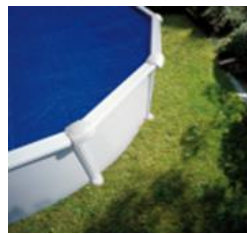
CPROV610 Cubierta Isotérmica Copertura Isotermica