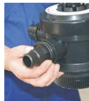
5 PONER LAS JUNTAS (10) EN LOS RACORD (9) APLICARLES TEFLON (15) EN LAS ROSCAS Y MONTARLOS EN LA BOMBA (1) Y EN LA VALVULA DEL FILTRO (4) BIEN APRETADOS PARA EVITAR PERDIDAS DE AGUA.