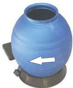
4 UNA VEZ SITUADO EL DEPOSITO GIRARLO UN POCO PARA AMARRARLO A LA PEANA.