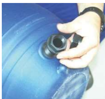
1 MONTAR EN EL DEPOSITO DEL FILTRO EL TAPON DE VACIADO (11) Y PONER EL TAPON DE CIERRE.