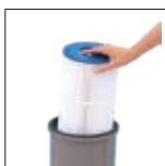
Elemento filtrante de fácil desmontaje