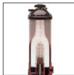
Filtro sección Star Clear™