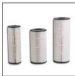
Cartuchos de reemplazo