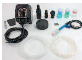
pH kit including dosing pump