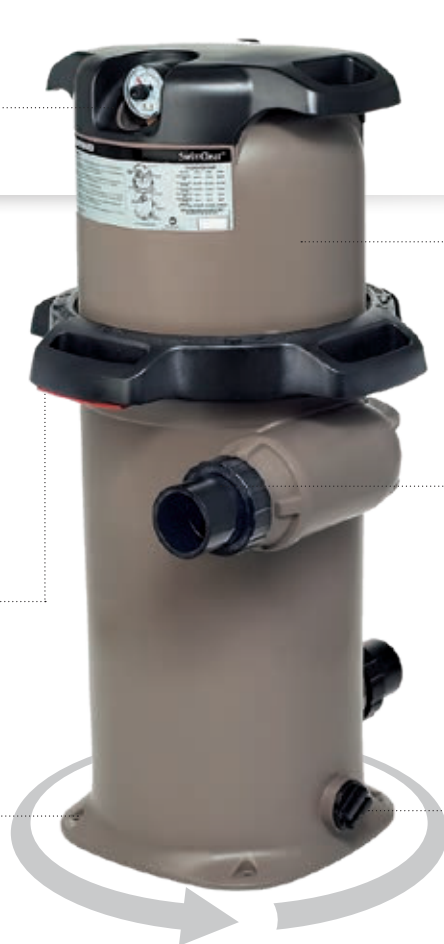
Filtro SwimClear™ monocartucho

Necesita poco espacio ideal para locales técnicos pequeños