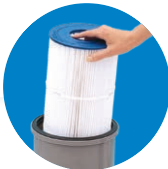
Medio filtrante de poliéster

Racores para facilitar las operaciones de instalación y sustitución