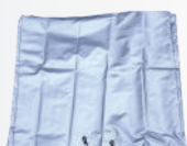
Funda de invierno