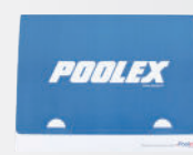
Caja de mantenimiento incluye manual de instrucciones en varios idiomas