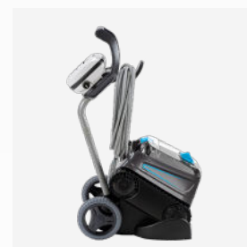
Carro de transporte