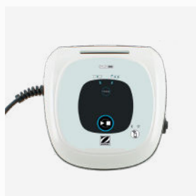
Unidad de control