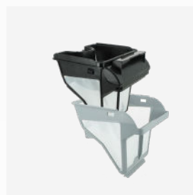
Filtro rectangular Filtro de doble nivel: 150/60 µ