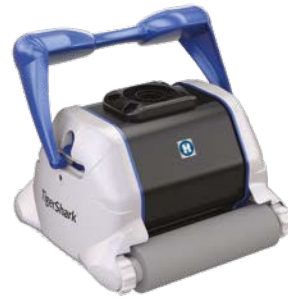
TigerShark® versión cepillo de espuma