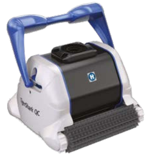
TigerShark® QC versión cepillo de plástico