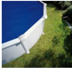
CPROV730 Cubierta Isotérmica Copertura Isotermica