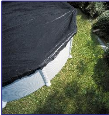
CIPROV731 Cubierta de Invierno Copertura invernale