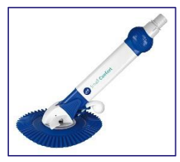
Limpiafondos automáticos Puliscifondo automatici