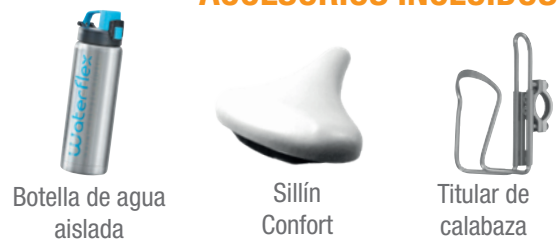
Botella de agua aislada