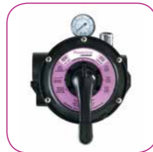
Vanne 6 positions 6 position valve Válvula 6 posiciones