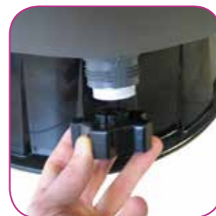
Drain avec son bouchon servant d'outil de démontage Drain with its plug which serves as dismantling tool. Drenaje que sirve para vaciar. El agua del filtro y facilitar así la operación de invernación